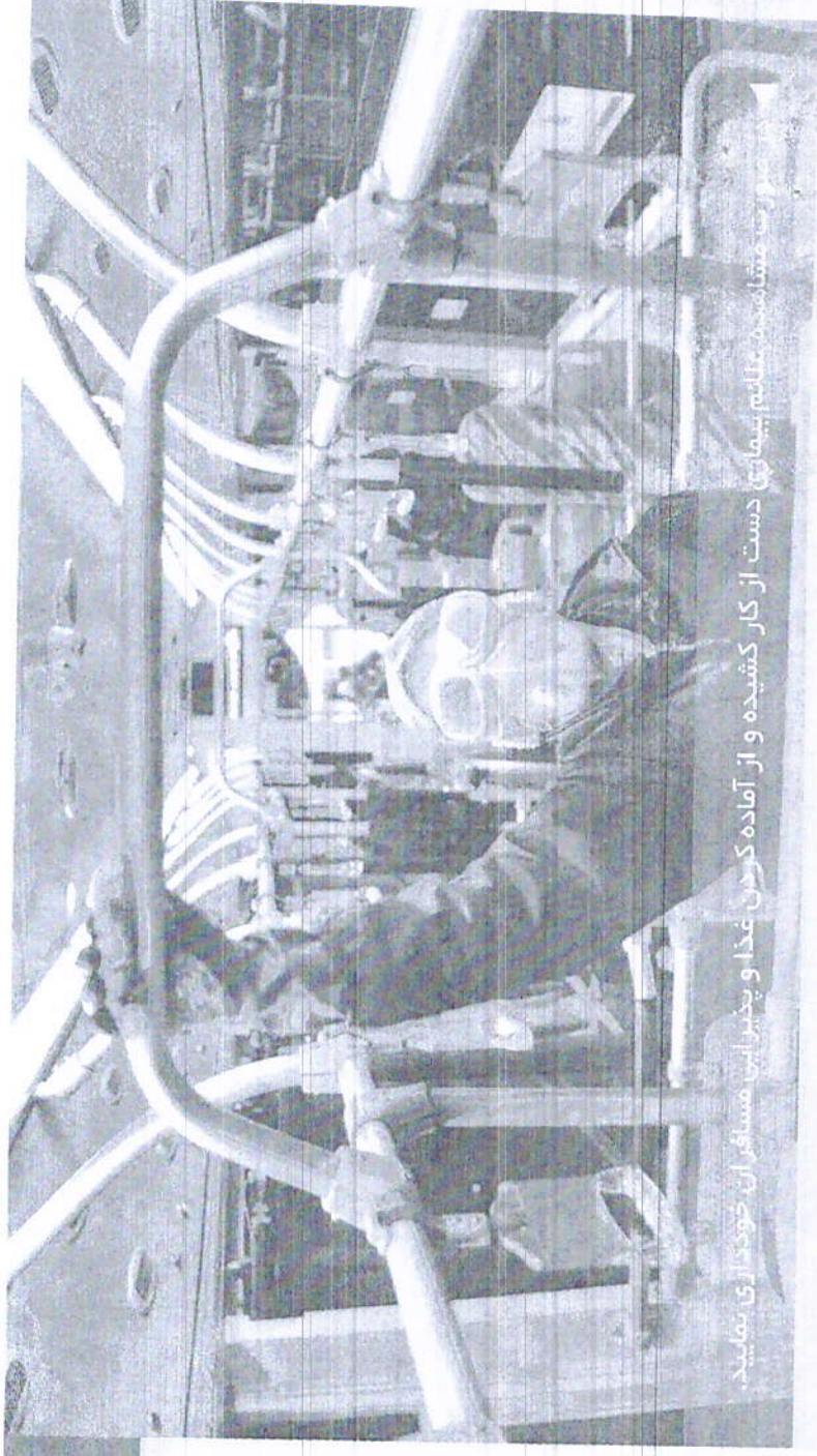
توجه به تمام بیماران دست از کار کشیده و از آماده کردن غذا و پذیرایی مسافران خودداری نمایید.

۴. ضد عفونی سطوح آلوده طبق دستورالعمل های استاندارد شرکت